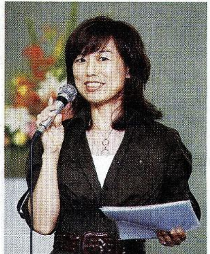
香川県高松市生まれ。インテリアコーディネーター協会代表。住宅や商業施設、医院などのインテリアデザインを手掛けている。

色の組み合わせは、下層を。素材によっても空間の雰囲気が変わる。暖かな無機質な材、ぬくもりや親しみを感じさせる自然素材など、自分の求めるインテリアのイメージを固めておく。